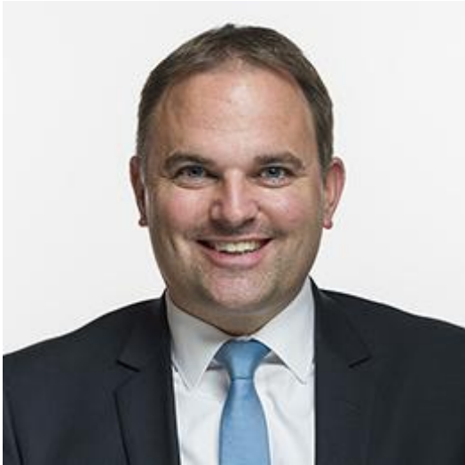
Marcel Dettling Nationalrat Präsident SVP Schweiz Pro