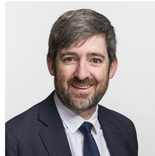
Philipp Kutter Nationalrat